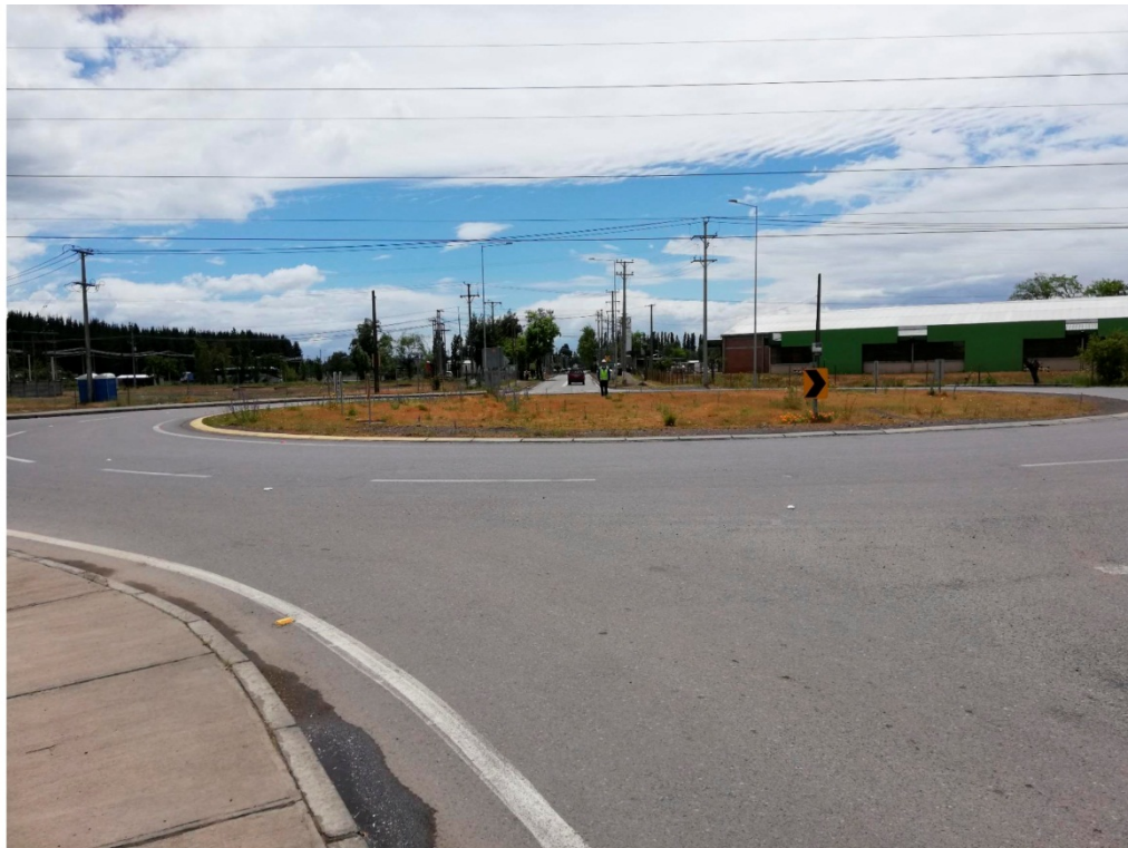
Imagen de área disponible en Rotonda Cholguán km 31.0